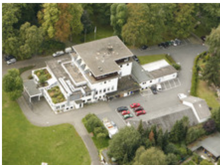
Blutspendedienst NordgGmbH in Lütjensee