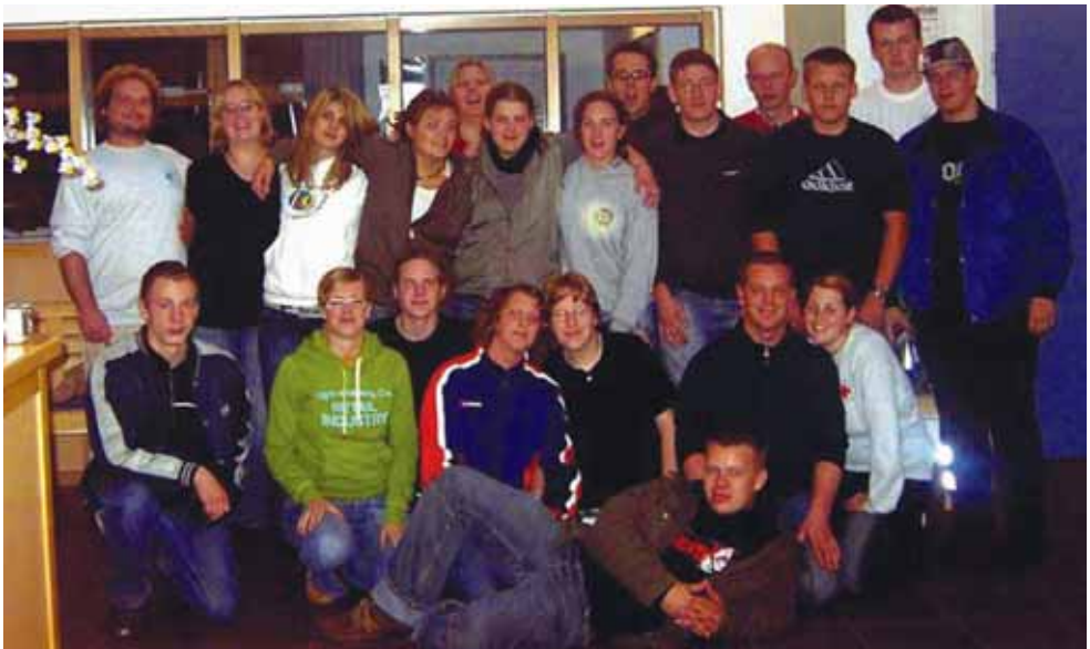
Teilnehmer aus dem Herbstlehrgang