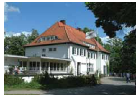
Elly Heuss-Knapp-Haus, Plön