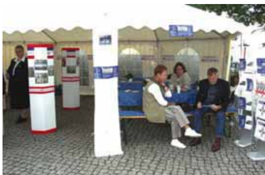
Aufgaben und Leistungen des DRK in Schleswig-Holstein

stätte, drei ambulante Pflegedienste, eine Tafel und die AIDS-Pflege Lübeck. Unter der Trägerschaft der Schwesternschaft Lübeck finden kostenlose Fortbildungen und Seminare für Pflegenden aus allen Bereichen zum Thema HIV und AIDS statt. Die AIDS-Pflege hat sich darüber hinaus sozialpolitisch zum Ziel gesetzt, die Ausgrenzung von Menschen mit HIV und AIDS durch Aufklärungsarbeit zu verhindern.