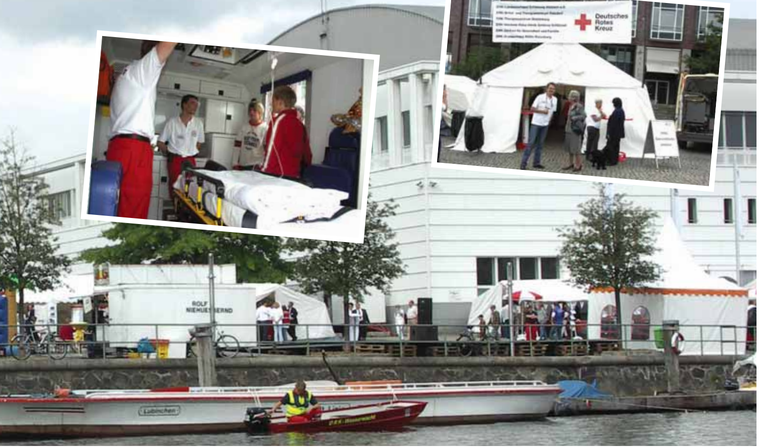
Impressionen zum Rotkreuztag