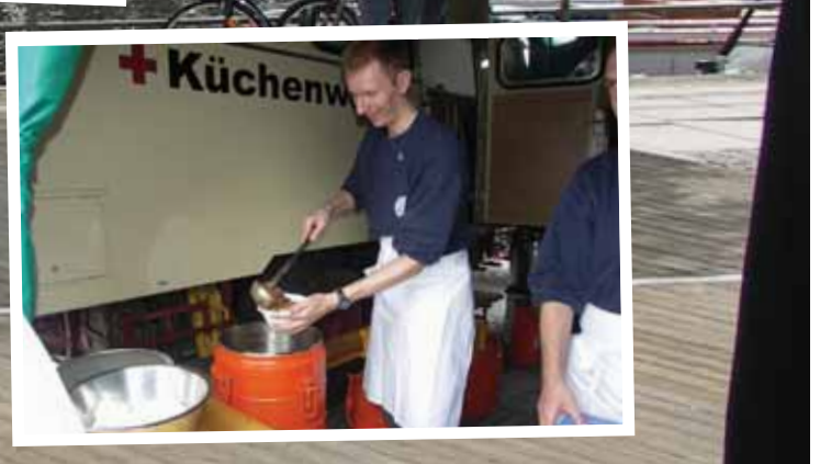
Impressionen zum Rotkreuztag