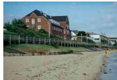
Alma Münster-Haus, Amrum