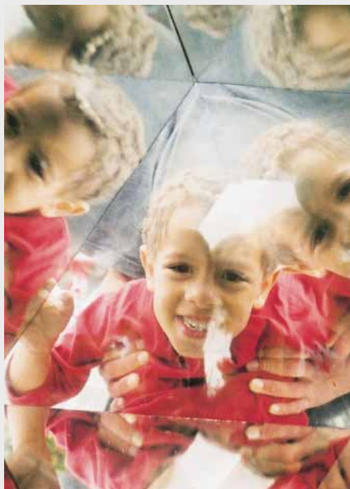
Der Schleswig- Holsteinische Rotkreuztag 2003 in Bild und Wort