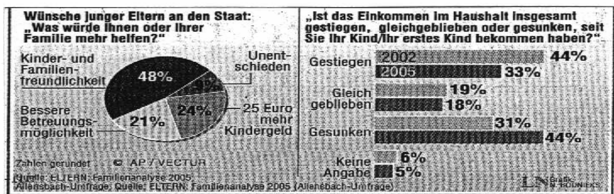
Abb. 5: Wünsche junger Eltern / Haushaltseinkommensentwicklung (aus Lübecker Nachrichten Januar 2005, S.3)

Der Staat übernimmt heute viele Funktionen, die früher durch die familiäre Gemeinschaft abgedeckt wurde. Viele Maßnahmen der Familienpolitik konzentrieren sich jedoch auf monetäre Leistungen. Zeitwerte oder gar sachwerte Leistungen werden zwar angedacht und diskutiert, doch die Umsetzung vollzieht sich nur langsam. Das mag wohl auch daran liegen, dass das deutsche Steuer- und Sozialsystem tradierten familialen Lebensformen nachhängt. Statistiken und Gutachten stellten machten deutlich, dass monetäre Leistungen stellen einen schwachen Stimulus zur Erhöhung der Geburtenrate dar. Der finanzielle Transfer stockt zwar das Familieneinkommen auf, doch nach der „Familien Analyse 2005“ der „Eltern-Zeitschrift“ steht ein kinderfreundliches Klima z.B. durch bessere Betreuungsangebote auf der Wunschliste derer, die gern ein Kind bekommen möchten, an vorderster Stelle. Die folgende Tabelle wird dies veranschaulichen.